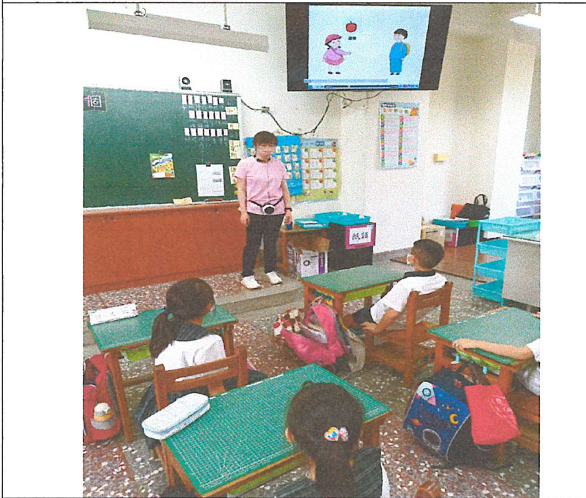
黃雅勵老師公開授課-共同觀課