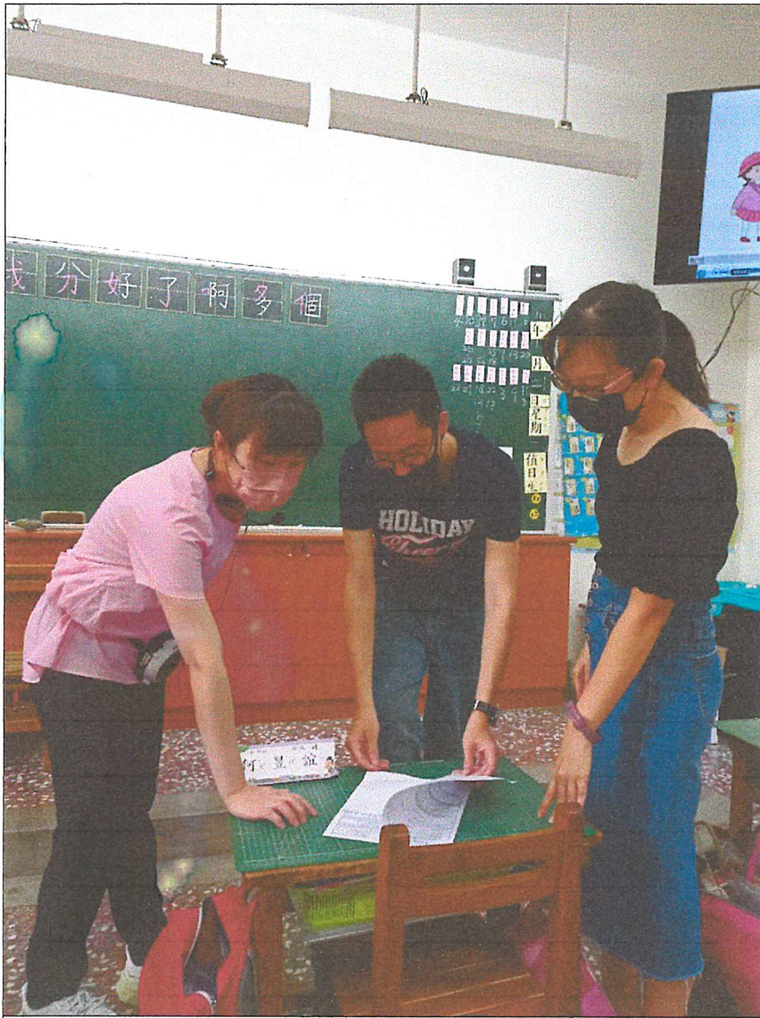
黃雅勵老師公開授課-共同議課